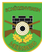
Schützenverein Meiersberg e.V.