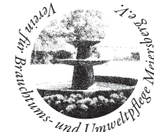
Verein für Brauchtums- und Umweltpflege Meiersberg e.V.