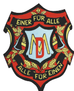
Freiwillige Feuerwehr Dippoldsberg-Meiersberg e.V.

... für ein neues Zuhause – für Heimat, Dorf und Vereine !