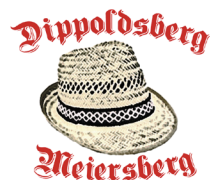
Ortsburschen und Ortsmadli Meiersberg-Dippoldsberg e.V.