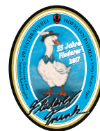
Fledererverein Meiersberg e.V.